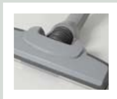
Gulvmundstykke med "active pick-up" funktion

Tænd / sluk eller variable Speed Control håndtag i forskellige slangelængder. Teleskoprør, Aspira gulvmundstykke, holder med børste- og fugemundstykke, og en slangeholder.