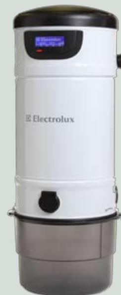
SC 395 LCD