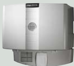
ZCV 750 E

De centrale støvsugersystemer fra Electrolux tilbyder dig en særdeles effektiv, stabil og støjsvag rengøringsløsning. Med et gennemtænkt design og markedsledende features letter Electrolux centralstøvsugere rengøringen og giver et sundere hjem.