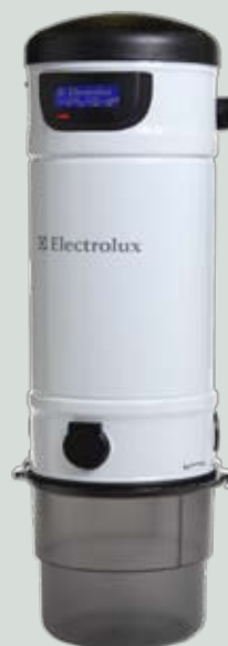
SC 375 LCD